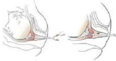
Figuur 3 ballon inleiding.

Een andere methode is het inleiden middels een foley katheter. De zg. ballon inleiding. Dit is het kunstmatig rijpen van de baarmoedermond. Aan de foley katheter zit een ballon die druk geeft, waardoor er op natuurlijke wijze prostaglandine vrij komen die voor rijping en ontsluiting van de baarmoedermond kunnen zorgen.